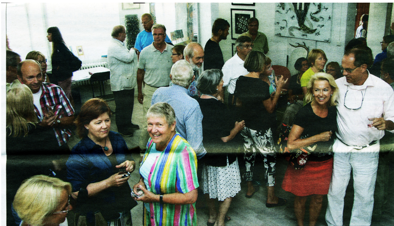
På tisdag förmiddag diskuterades mötet mellan musiken och bildkonsten på Galleri E. Pinomaa.